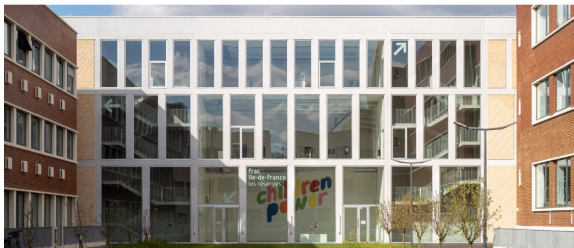
Vue de des Réserves du Frac Île-de-France

Les candidatures se font individuellement uniquement. Un champ dédié du formulaire de candidature permet néanmoins de mentionner d'autres personnes qui candidateraient également, en cas de volonté de collaborer avec elles.