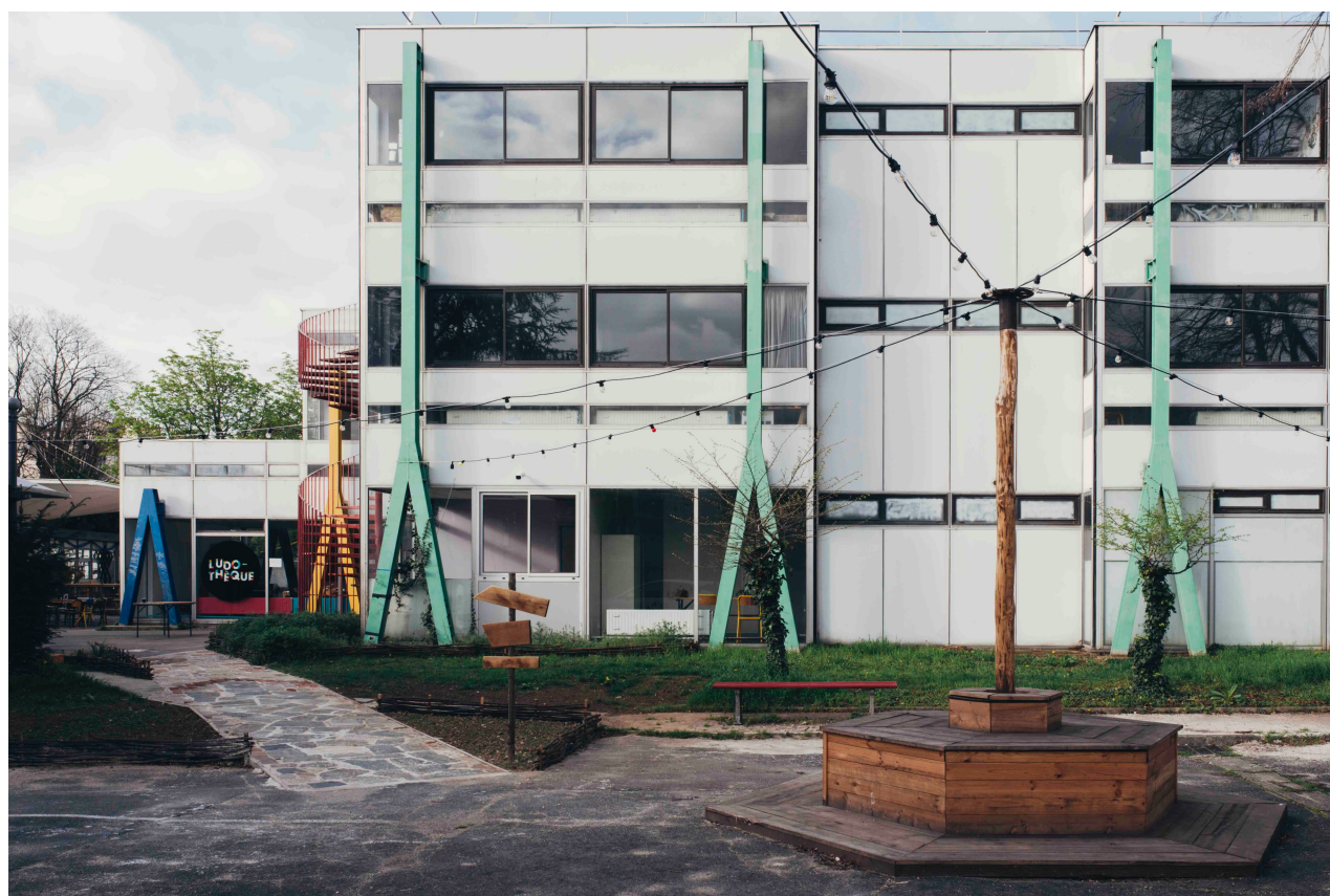
Vue d'Artagon Pantin

Facebook – Instagram – LinkedIn : @artagonofficiel