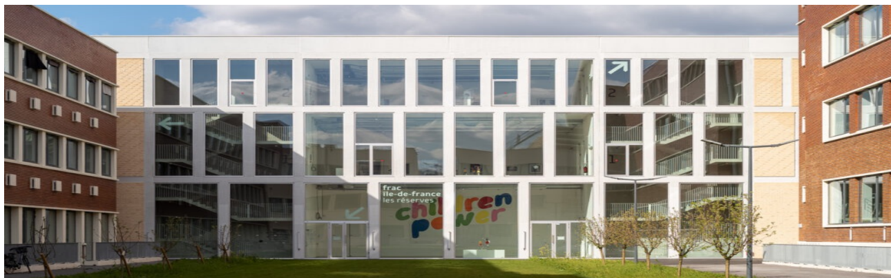
Vue de des Réserves du Frac Île-de-France