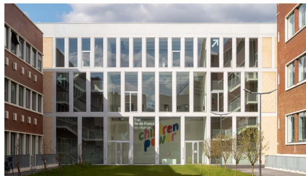
Vue de des Réserves du Frac Île-de-France – Photo Martin Argyroglo - © Frac Île-de-france

Les candidatures se font individuellement uniquement. Un champ dédié du formulaire de candidature permet néanmoins de mentionner d'autres personnes qui candidateraient également, en cas de volonté de collaborer avec elles.