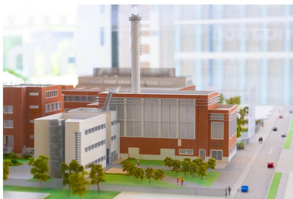
Maquette de la Chaufferie de la Fondation Fiminco